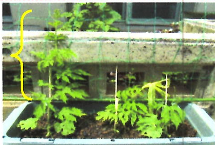
つるがグングンのびてきたよ! どこまでのびていくのだろう?