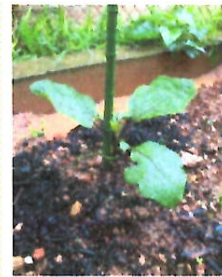
雨が降って葉が元気になった。