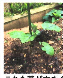
これも葉が大きくなってきたよ!