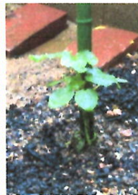
上の葉の形が変わったよ!