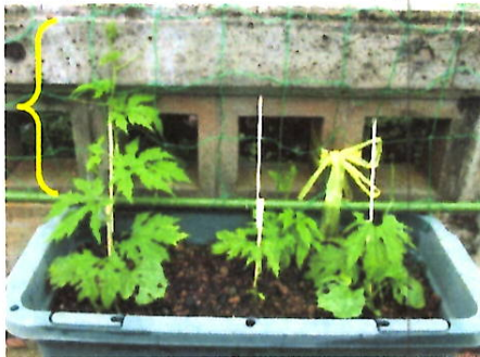
葉がネットに巻きついてきたね!