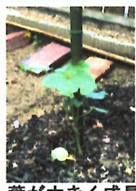
葉が大きく成長しているね! 葉脈の色が違うね! 不思議だな?