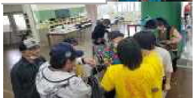
大山・伊佐老人会 世代交流輪投げ大会