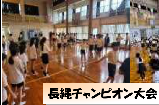
長縄チャンピオン大会