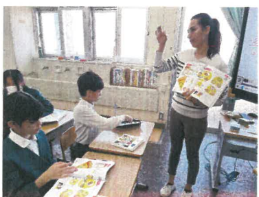
教材の工夫 方向・教室